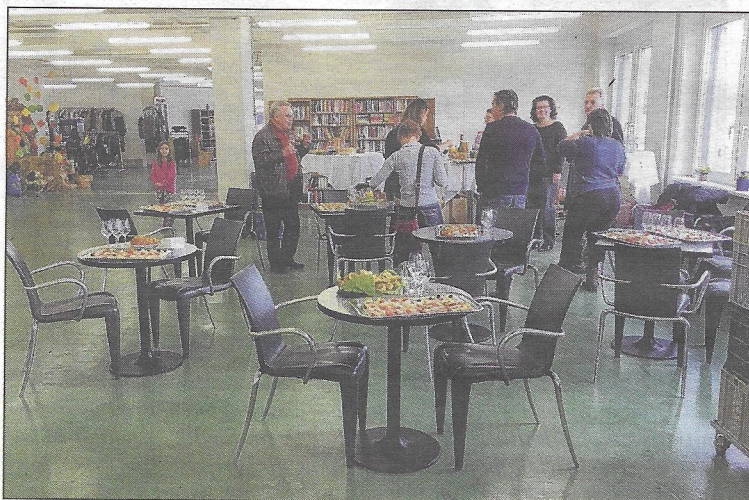
Bei einem feinen Eröffnungsapéro wurde das neue gemütliche Café «s Atelier» eingeweiht.

Unsere bisherige Erfahrung zeigt, dass die allermeisten Menschen eine Arbeitsleistung erbringen möchten und dazu auch fähig sind, vorausgesetzt, sie werden ihren Möglichkeiten entsprechend eingesetzt. Mit differenzierten Angeboten bietet der Verein Cartons du Coeur (CdC) mit dem neuen Projekt «s Atelier» Personen ohne Tagesstruktur eine geregelte, begleitete und sinnvolle Beschäftigung. Mit