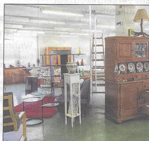
Kostüme für die Fasnacht, Alltagskleider, Haushaltartikel, Möbel und vieles mehr erwartet Besucher in der neuen Brockenstube.